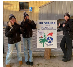
Bilder från två av de säljande lagens instagram @alvsjoaikibdj och @alvsjoaikibf0607