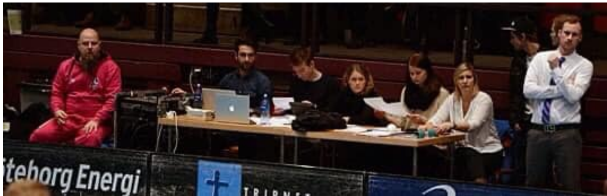
Stilkampen i Lisebergshallen